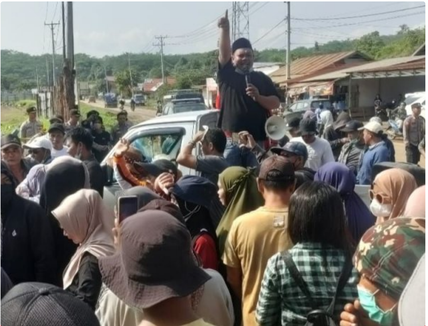
Tampak Korlap Aksi Demo Menyampaikan Orasinya di depan Kantor AFB Desa Lalampu

MOROWALI, Sulawesi Tengah- Tuntutan Aksi Demo yang dilakukan sejumlah warga Desa Lalampu masih menunggu keputusan dari PT Ang and Fang Brother (AFB) perusahaan tambang yang berlokasi di desa tersebut.