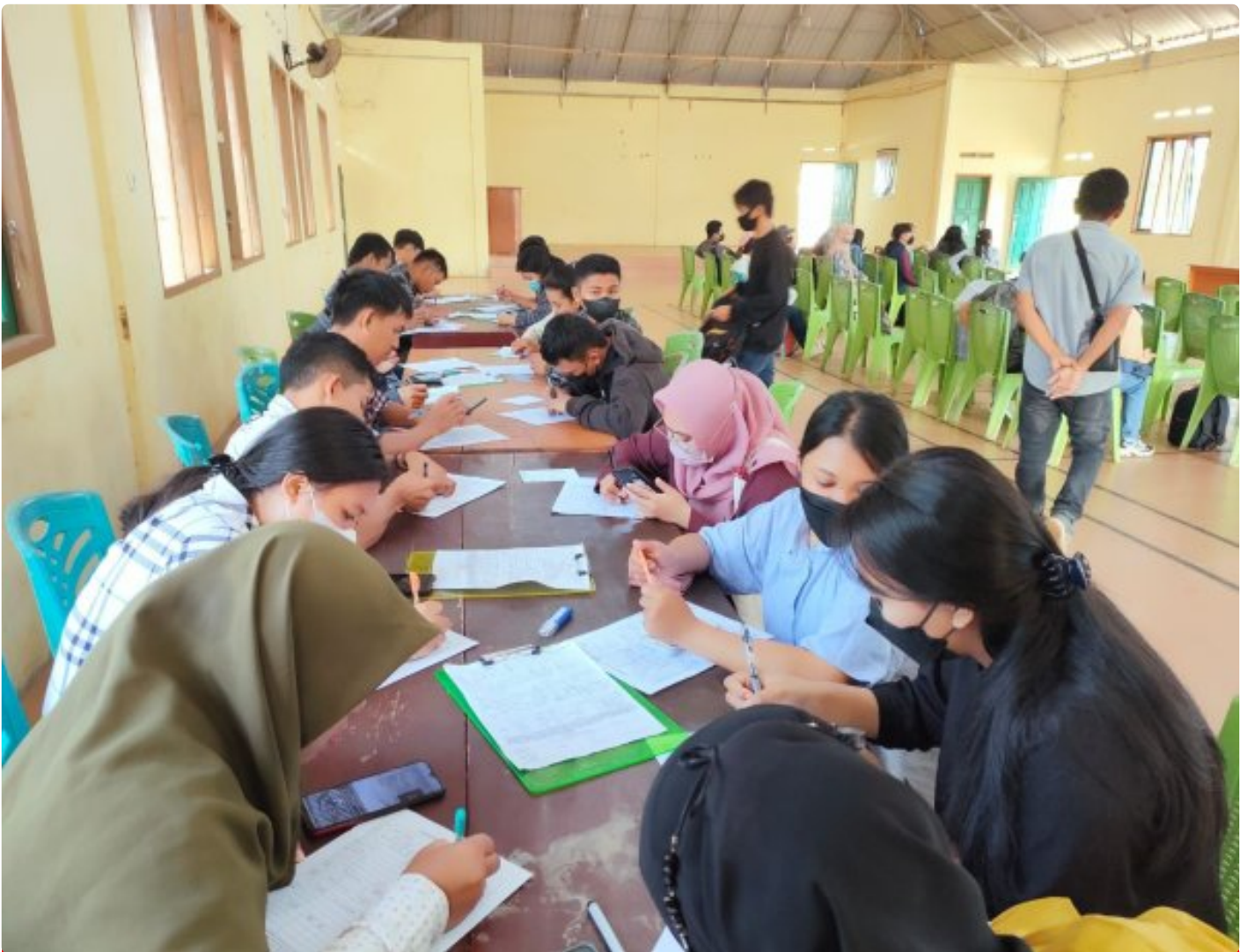
Tampak Antusias Pencaker Ikuti Job fair yang digelar PT GNI di Desa Molino

MOLINO, Morut Sulteng- PT Gunbuster Nickel Industry (GNI) secara beruntun melakukan Job Fair atau perekrutan langsung di sejumlah Desa Kecamatan Petasia Timur, Kabupaten Morowali Utara (Morut).