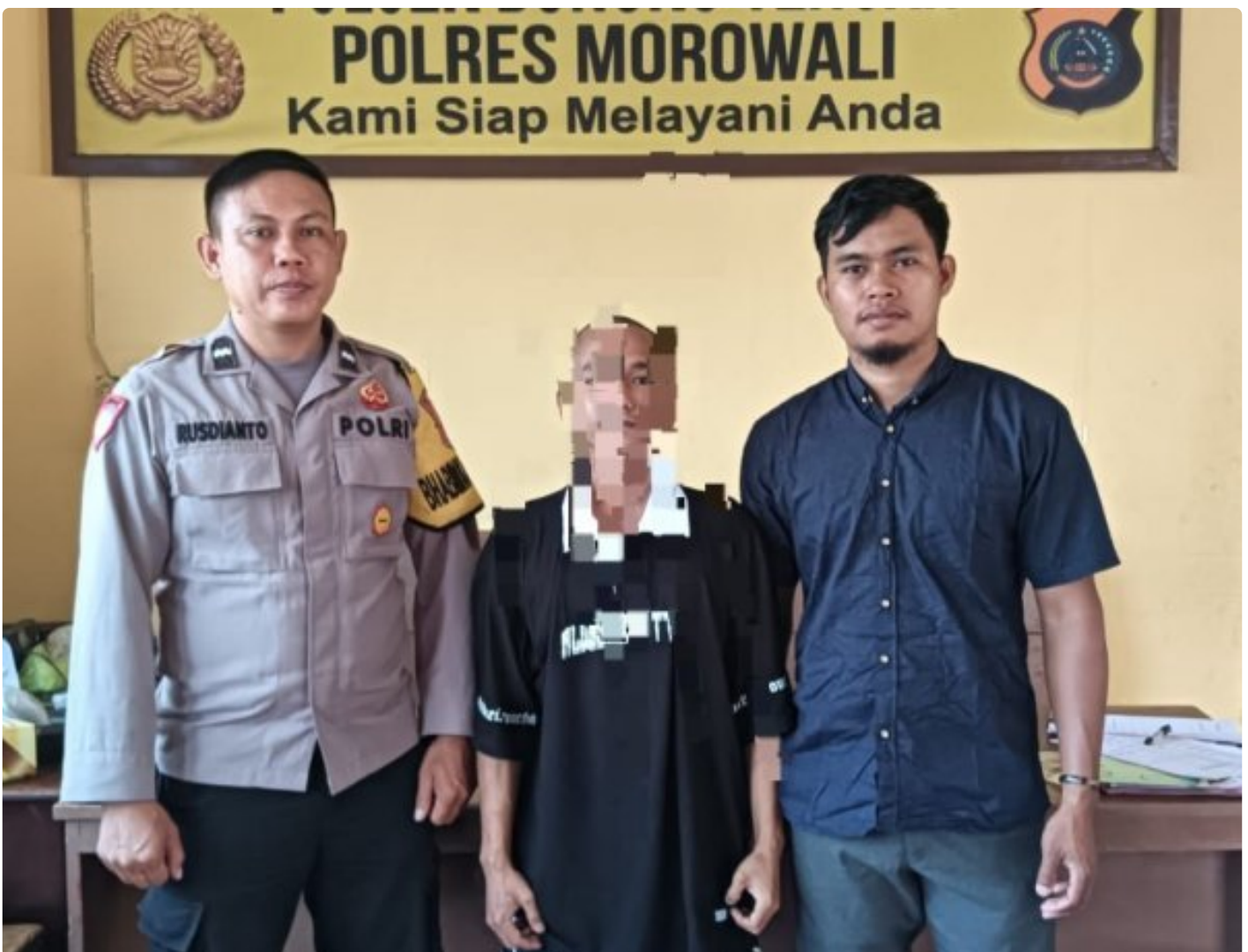
Aparat Polsek Bungku Tengah Berhasil Tangkap Pelaku Curanmor

MOROWALI, Sulawesi Tengah- Pada Hari Sabtu 5 Oktober 2024 Sekitar Pukul 18.30 Wita Kepolisian Sektor (Polsek) Bungku Tengah Polres Morowali, berhasil mengungkap kasus pencurian kendaraan bermotor (curanmor) yang terjadi di