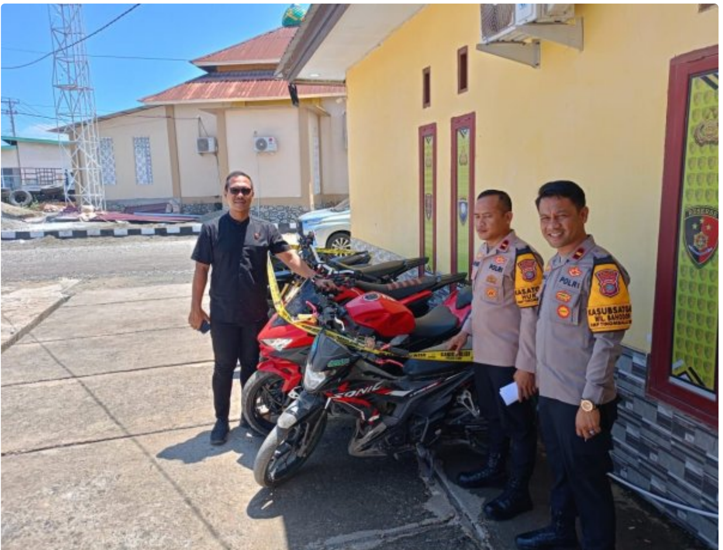
Tampak 6 Unit Sepeda Motor Hasil Curanmor diamankan Polsek Bahodopi

MOROWALI, Sulawesi Tengah- Polsek Bahodopi, Polres Morowali, Polda Sulteng Berhasil Ungkap Pelaku Pencurian Kendaraan Bermotor (Curanmor) dan Pelaku Penadahan Hasil Curian Kendaraan Bermotor yang Terjadi Di Kecamatan