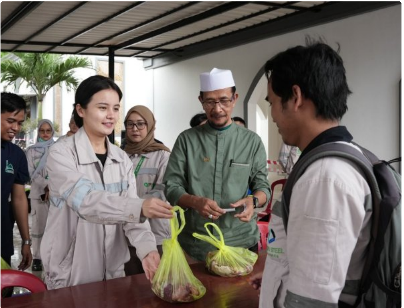
Karyawan non muslim di PT IMIP panitia kurban