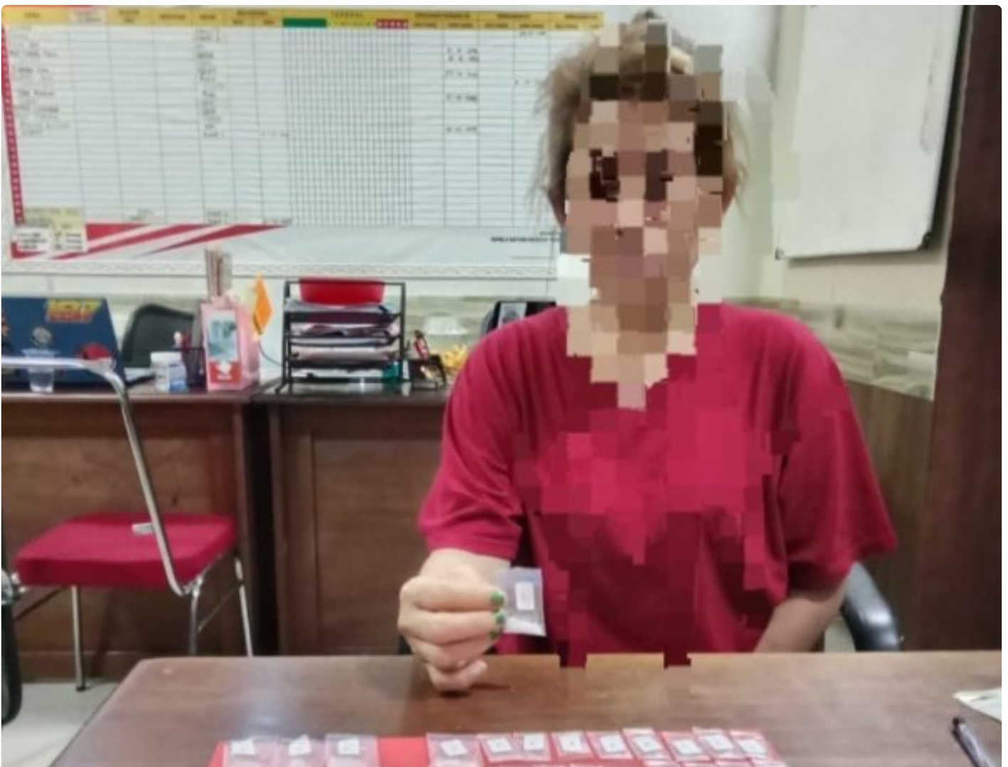
Tampak Salah Satu Tsk Perempuan beserta Babuk Sabu

MOROWALI, Sulawesi Tengah- Satuan Reserse Narkoba (Sat Resnarkoba) Polres Morowali berhasil mengungkap kasus penyalahgunaan narkotika jenis sabu di wilayah hukum Polres Morowali, Provinsi Sulawesi Tengah, di awal tahun