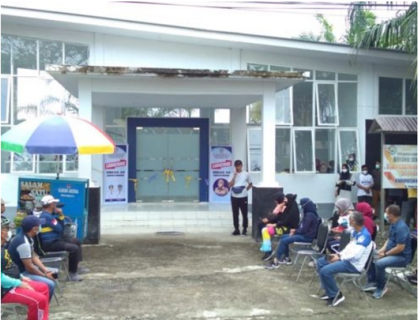
Bupati Morowali saat meresmikan rumah oleh-oleh

MOROWALI, Sulawesi Tengah-Pemerintah Daerah Kabupaten Morowali kembali melahirkan inovasi dalam pembangunan. Dalam hal ini Dinas Koperasi dan Usaha Kecil Menengah Kabupaten Morowali, meluncurkan Rumah oleh oleh, untuk mendorong pelaku usaha mikro kecil menengah (UMKM) berinovasi dalam memasarkan/mempromosikan produknya.